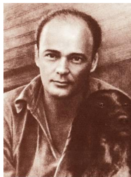
Е. И. Чарушин. С. фотографии 1936 г.

11 ноября 2016 года исполнилось 115 лет Евгению Ивановичу Чарушину — советскому графику, скульптору и писателю.